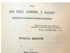
_ □ GuiSan02