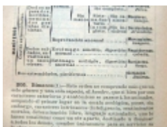
_ □ GuiSan04