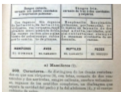
_ □ GuiSan03