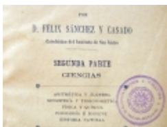
_ □ GuiSan01