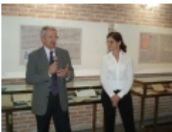
□ OLYMPUS DIGITAL CAMERA