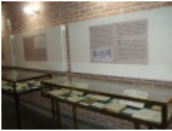
□ OLYMPUS DIGITAL CAMERA