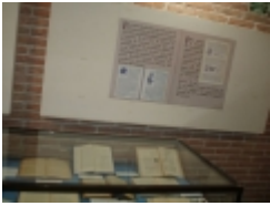
□ OLYMPUS DIGITAL CAMERA