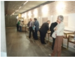
□ OLYMPUS DIGITAL CAMERA