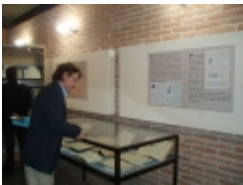
□ OLYMPUS DIGITAL CAMERA