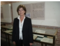
□ OLYMPUS DIGITAL CAMERA