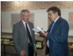
□ OLYMPUS DIGITAL CAMERA