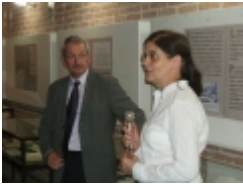
□ OLYMPUS DIGITAL CAMERA