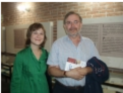
□ OLYMPUS DIGITAL CAMERA